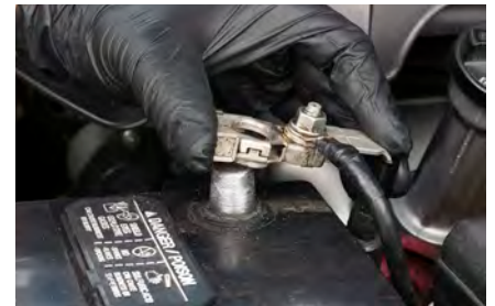
Paso 8: volver a conectar el cable positivo.