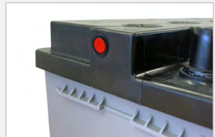
Coloque el tapón de ventilación en el lado opuesto a la manguera de ventilación.