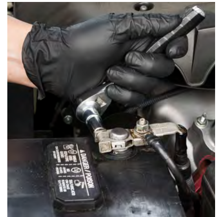
Paso 3: desconectar el cable positivo.

Retire la batería vieja del vehículo, levantándola con seguridad. A continuación, coloque la batería nueva en su lugar. Limpie la bandeja de la batería y, a continuación, coloque la batería nueva.