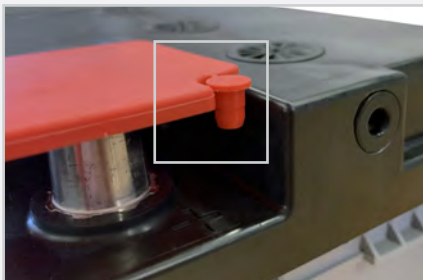
El tapón de ventilación se encuentra en la esquina de la cubierta del borne positivo, es decir, el borne de color rojo.

A fin de determinar si es necesario ventilar la batería, consulte el manual del propietario del vehículo. Una batería que no está ventilada de manera adecuada puede provocar la acumulación de gases nocivos en el vehículo. De ser necesario, conecte la manguera de ventilación del vehículo a la toma de ventilación de batería más cercana. Coloque el tapón de ventilación en el lado de la batería OPUESTO a la manguera de ventilación. (El tapón viene incluido).