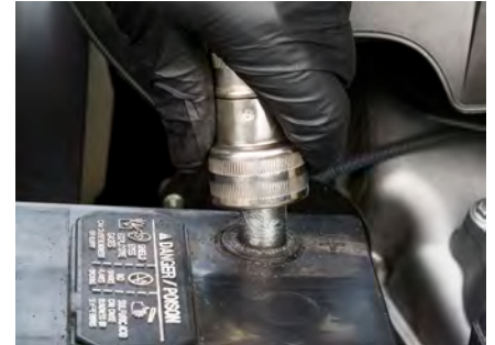
Paso 6: limpiar los bornes.

Asegúrese de que la abrazadera quede bien colocada hacia abajo; luego, ajuste el sujetador. Asegúrese de que la abrazadera quede bien colocada hacia abajo; luego, ajuste el sujetador. No golpee las abrazaderas del cable sobre el borne y tampoco apriete demasiado los sujetadores.