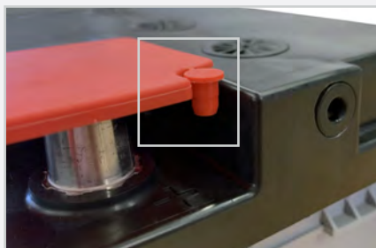
Localisez le bouchon de ventilation sur le coin du couvercle de la borne positive rouge.

Consultez le manuel du propriétaire du véhicule pour déterminer si la ventilation de la batterie est nécessaire. Une batterie mal ventilée peut entraîner l'accumulation de gaz nocifs à l'intérieur du véhicule. Si nécessaire, raccordez le tuyau de dégazage du véhicule au bouchon d'aération de la batterie le plus proche. Installez le bouchon d'aération fourni sur le côté de la batterie qui est OPPOSÉ au tuyau de dégazage.