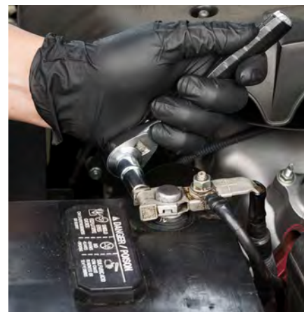
Étape 3 – Débranchez le câble positif.

Localisez la borne positive, elle aura un symbole plus (+). Il peut être recouvert par un capuchon, un panneau de fusibles ou un autre composant du véhicule. Débranchez le collier de serrage du câble positif en desserrant la fixation du collier de serrage. Une fois le collier de serrage retiré, remettez le capuchon sur le collier de serrage du câble positif ou enveloppez-le dans une serviette. Mettez-le de côté et ne le laissez pas entrer en contact avec le métal du véhicule pendant toute la durée du processus de remplacement.