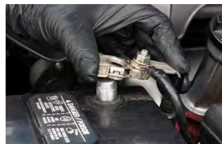
Étape 8 – Réinstallez le câble positif.