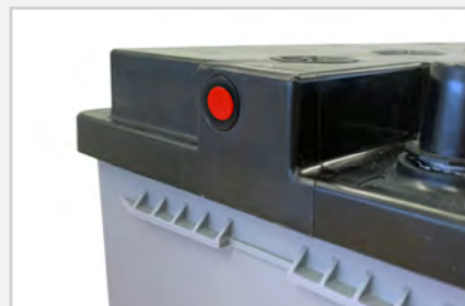
Insérez le bouchon d'aération sur le côté opposé au tuyau de dégazage.