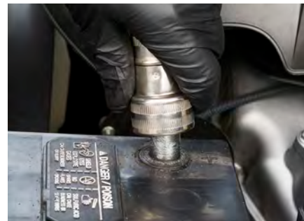
Étape 6 – Nettoyez les bornes.

Assurez-vous que la pince est bien en place, puis serrez la fixation. Assurez-vous que la pince est bien en place, puis serrez la fixation. Ne pas enfoncer les serre-câbles sur la borne et ne pas trop serrer les fixations.